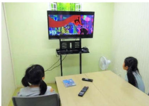
写真(上)43 インチ・モニターと PC、 WEB カメラを使う児童