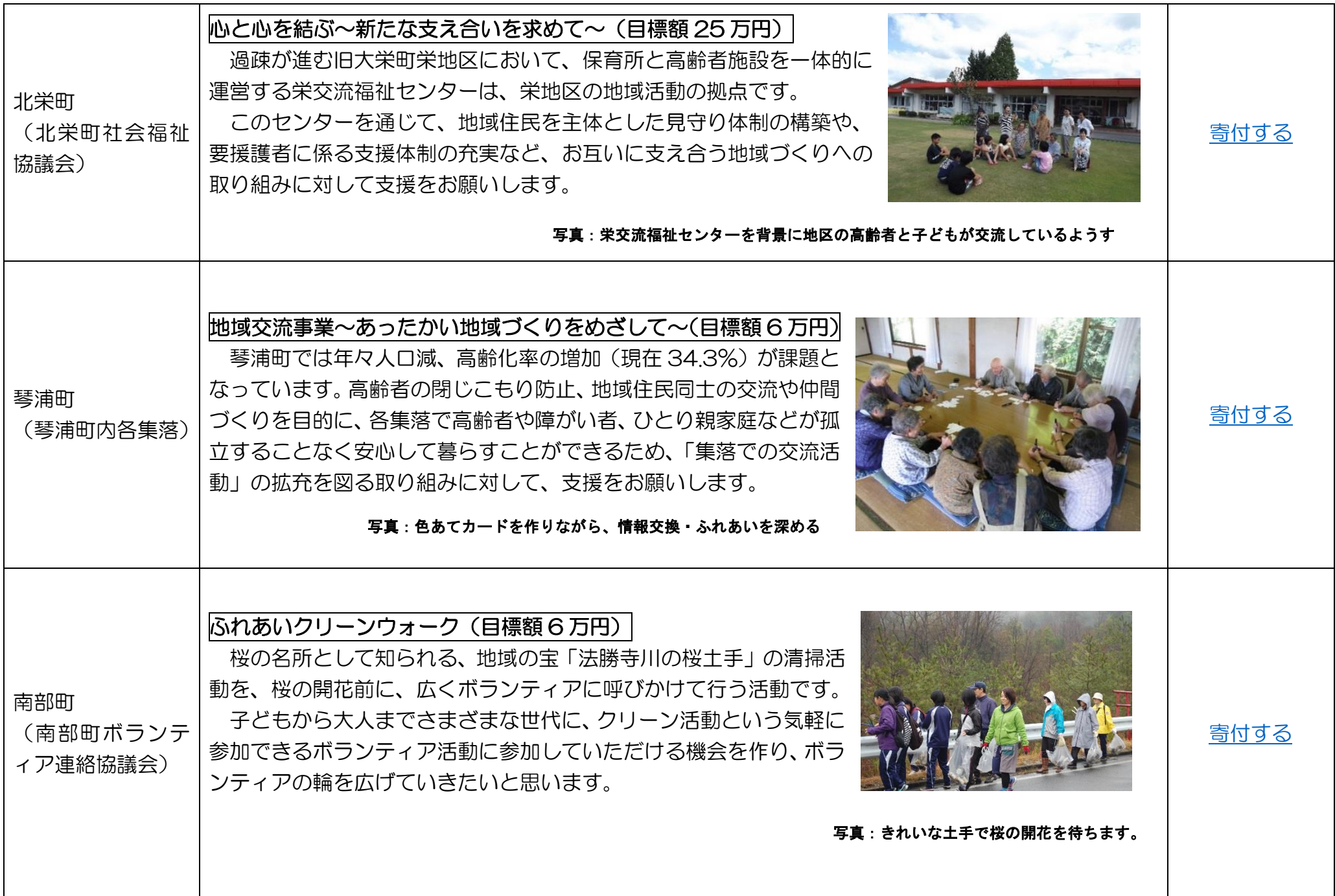
写真：栄交流福祉センターを背景に地区の高齢者と子どもが交流しているようす