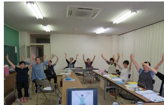
写真：サロンで心も体もリフレッシュ