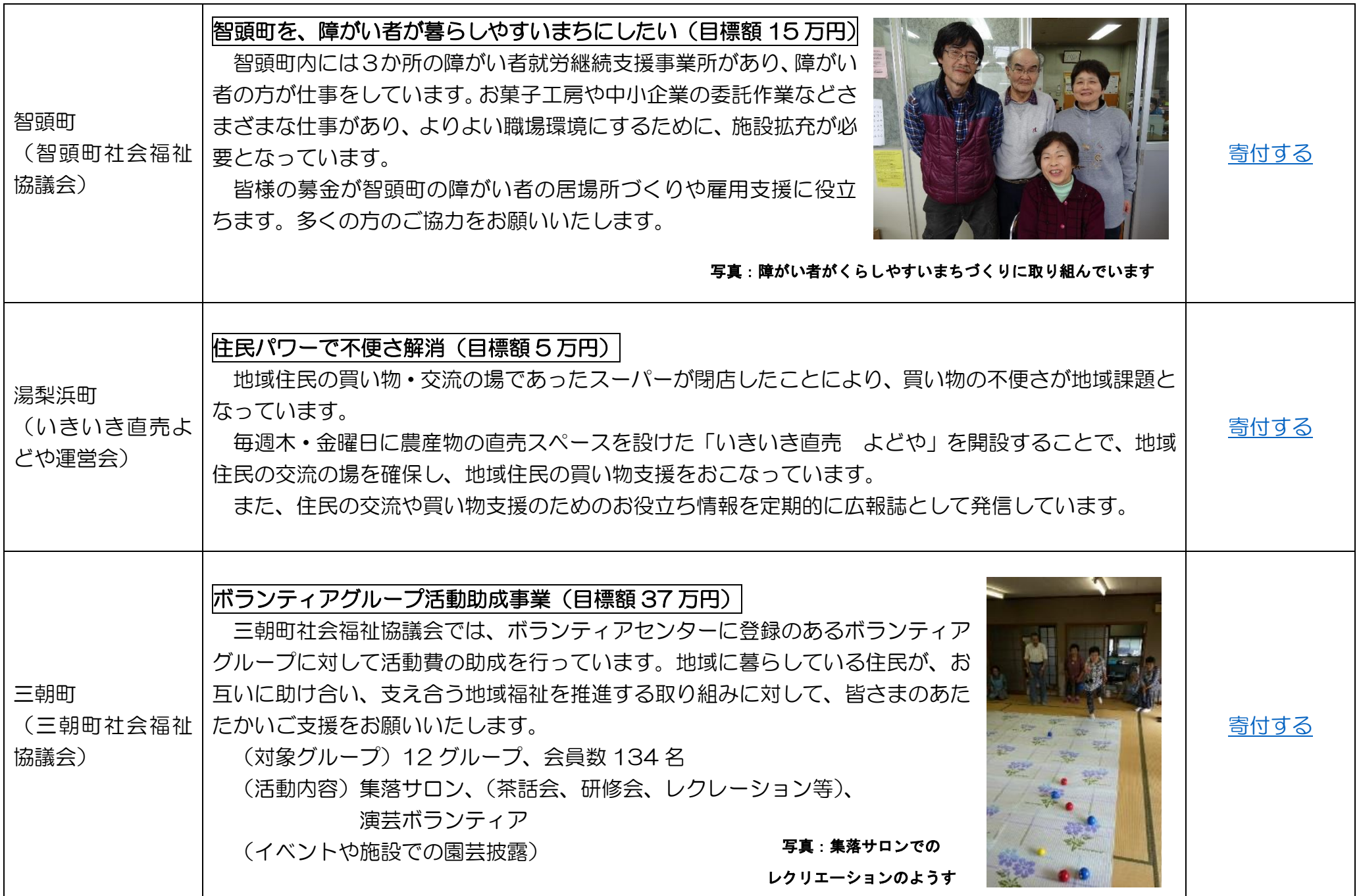
写真：障がい者が暮らしやすいまちづくりに取り組んでいます