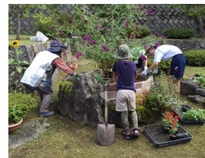
写真：体験・交流！地域のボランティア団体と一緒に美化活動中